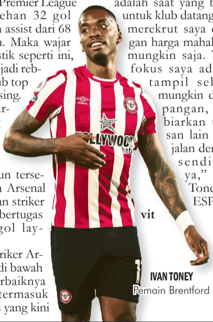
IVAN TONEY Pemain Brentford

Striker-striker Arsenal tampil di bawah performa terbaiknya musim ini, termasuk Gabriel Jesus yang kini